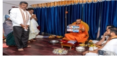
21/11/2023ರಿಂದ 27/11/2023ರವರೆಗೆ ಎಂ.ಇ.ಎಸ್. ಆರ್.ಎನ್.ಶೆಟ್ಟಿ ಪಾಲಿಟೆಕ್ನಿಕ್‌ನಲ್ಲಿ "ಭಗವದ್ಗೀತಾ ಆಭಿಯಾನ" ಕಾರ್ಯಕ್ರಮ.