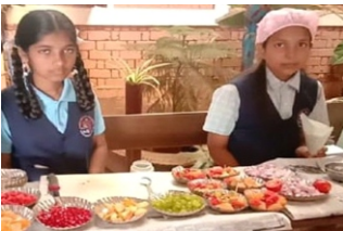
18/11/2023: ಶನಿವಾರದ ಬ್ಯಾಂಗ್ ರಹಿತ ದಿನದ ಅಂಗವಾಗಿ ಏರ್ಪಡಿಸಲಾದ ಆಹಾರ ಮೇಳ