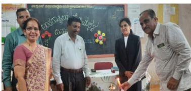
9/10/2023: ಹೆಣ್ಣು ಮಕ್ಕಳ ಸುರಕ್ಷತೆಗೆ "ಅಂತರಾಷ್ಟ್ರೀಯ ಹೆಣ್ಣು ಮಕ್ಕಳ ದಿನ"ದ ಆಚರಣೆ