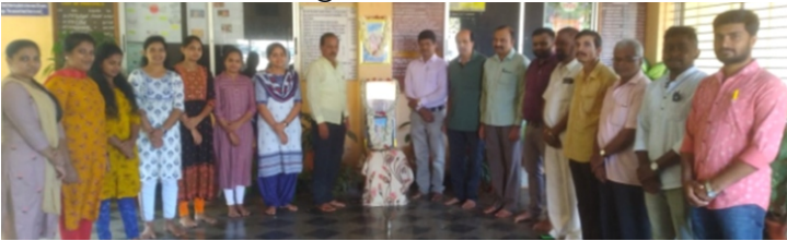
30/11/2023: ಕನಕದಾಸ ಜಯಂತಿ ಕಾರ್ಯಕ್ರಮ