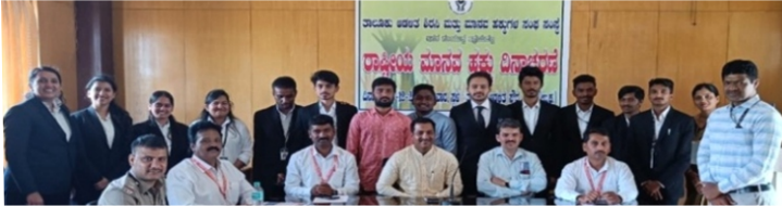
10/12/2023: ರಾಷ್ಟ್ರೀಯ ಮಾನವ ಹಕ್ಕು ದಿನಾಚರಣೆ