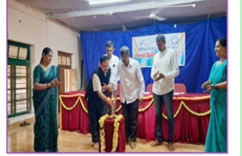
ಎಂ.ಇ.ಎಸ್ ಎಂ.ಎಂ.ಕಲಾ ಮತ್ತು ವಿಜ್ಞಾನ ಮಹಾವಿದ್ಯಾಲಯದಲ್ಲ ಪ್ಯಾಷನ್ ಡಿಸೈನ್ ಕೋರ್ಸ್ ಆರಂಭ