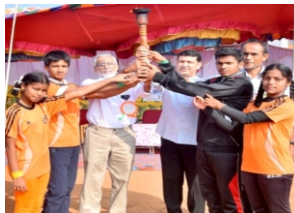
15/12/2023: ವಾರ್ಷಿಕ ಕ್ರೀಡಾಕೂಟ ಉದ್ಘಾಟನೆ